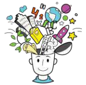
Figura 2 - Pôster apresentado na II Mostra de Extensão Fae UEMG