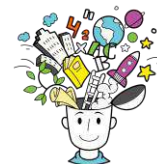
Quadro 2 - Quadro analítico 2