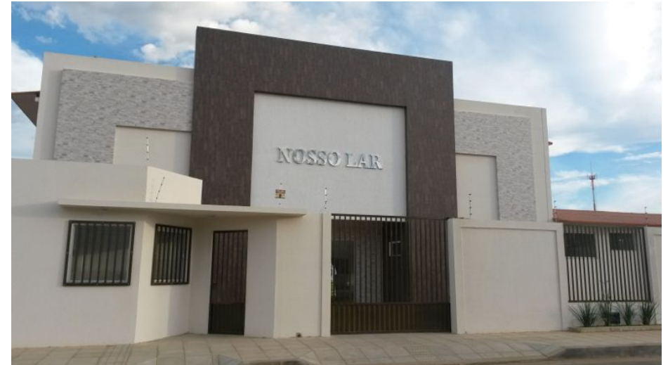
Imagem 1: sede do Abrigo Nosso Lar, locus da pesquisa.