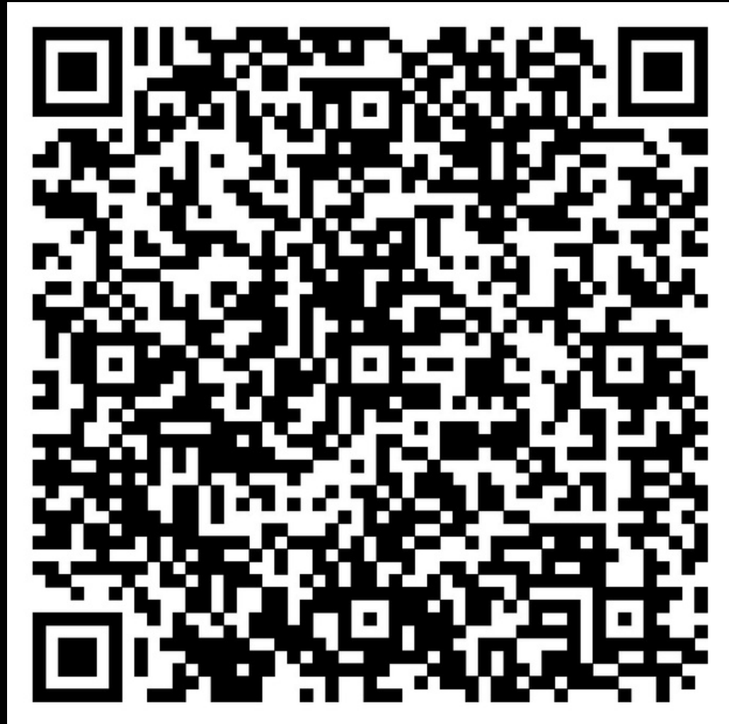
Diário de Bordo