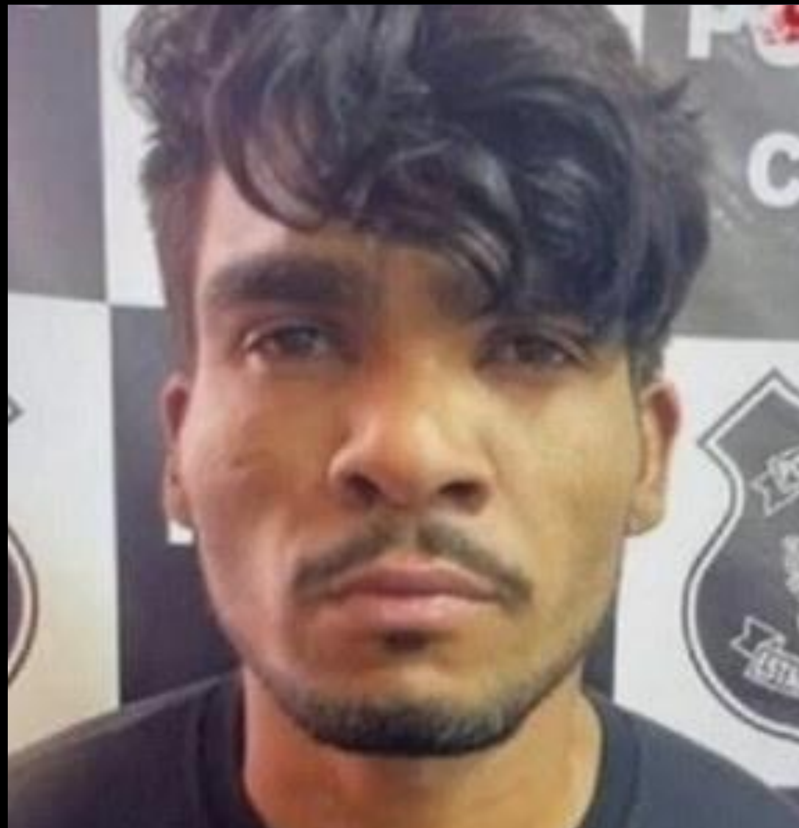
Lázaro Barbosa/Foto: Reprodução